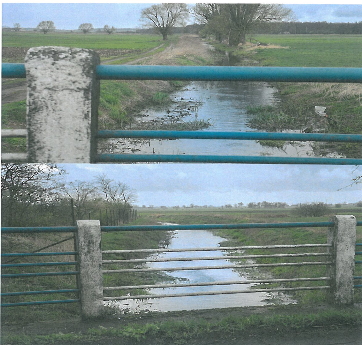
Zdjęcia wykonano w punkcie zaznaczonym na mapie ze str. 4 analizy