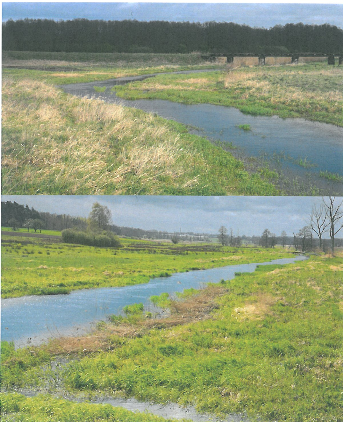
Zdjęcia wykonano w punkcie zaznaczonym na mapie ze str. 4 analizy

Rzeka Swędrnia w ca. 95% stanowi granicę pomiędzy Gminą Żelazków, Miastem Kalisz i Gminą i Miastem Opatówek